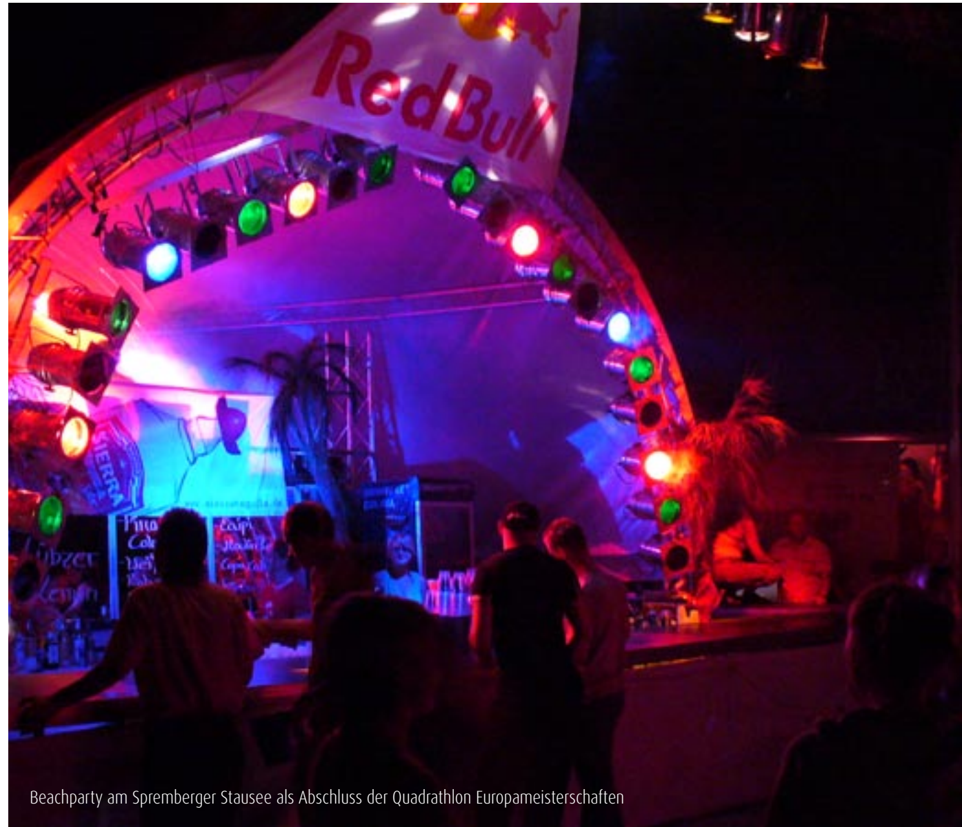
Beachparty am Spremberger Stausee als Abschluss der Quadrathlon Europameisterschaften