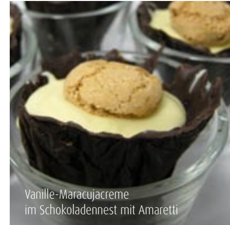
Vanille-Maracujacreme im Schokoladennest mit Amaretti