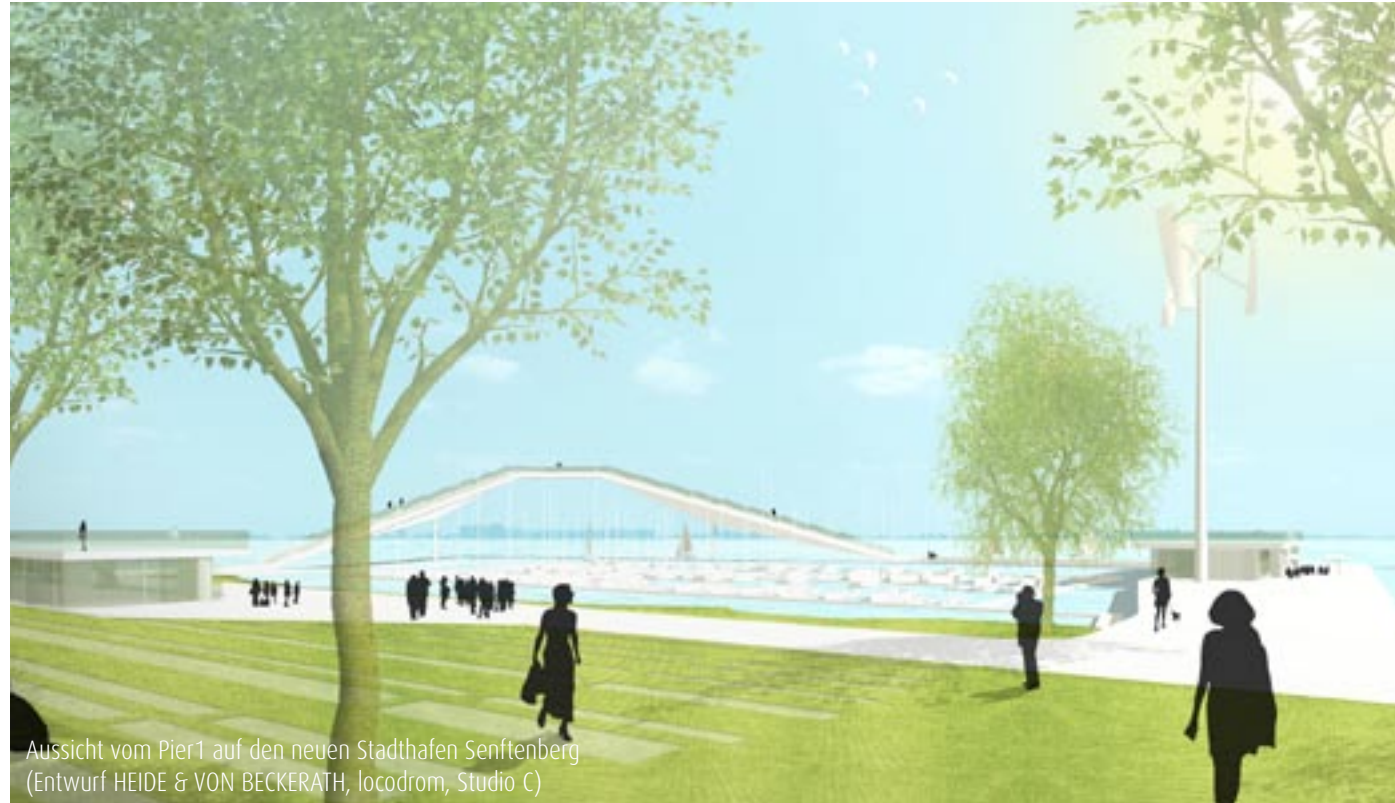
Aussicht vom Pier1 auf den neuen Stadthafen Senftenberg (Entwurf HEIDE & VON BECKERATH, locodrom, Studio C)

Unser Ziel ist die Begeisterung Ihrer Gäste