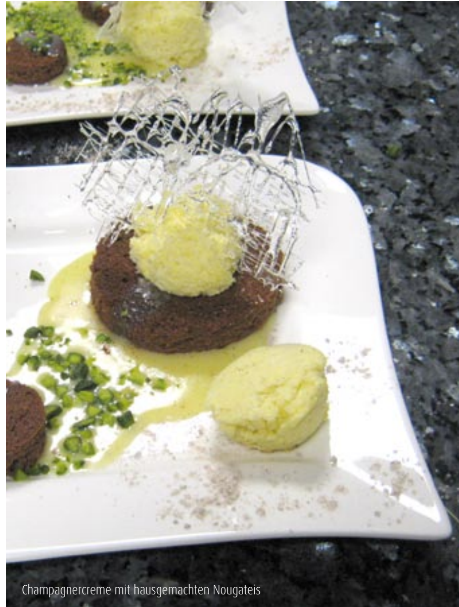
Champagnercreme mit hausgemachten Nougateis