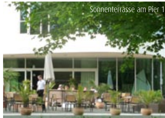
Sonnenterrasse am Pier 1