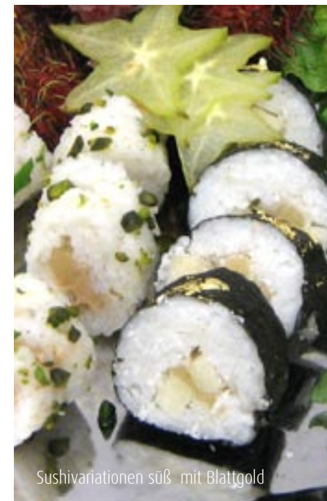
Sushivariationen süß mit Blattgold