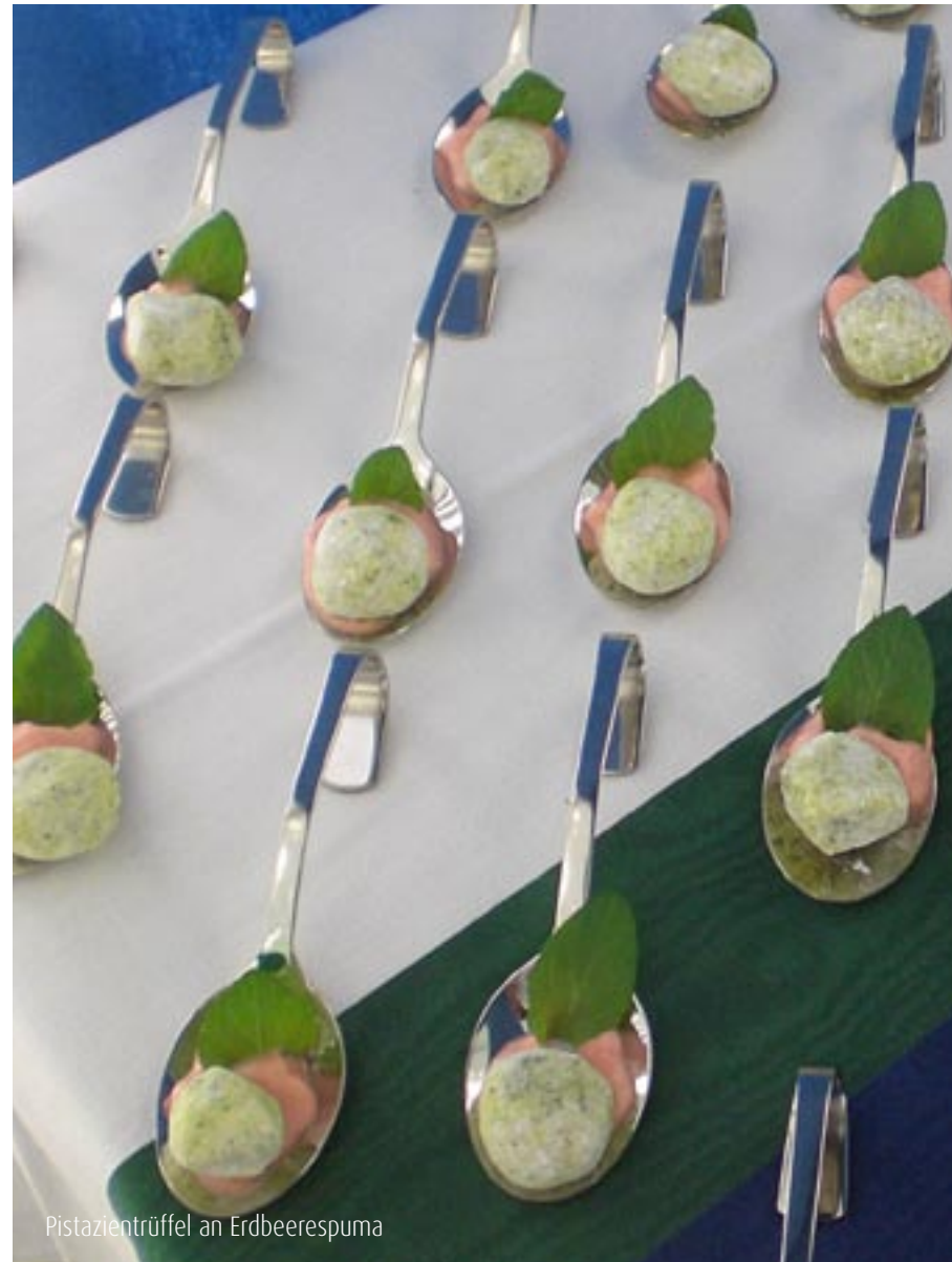
Pistazienrüffel an Erdbeerespuma